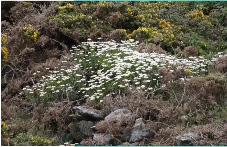
Margaridas ( Leucanthemum corunnense )